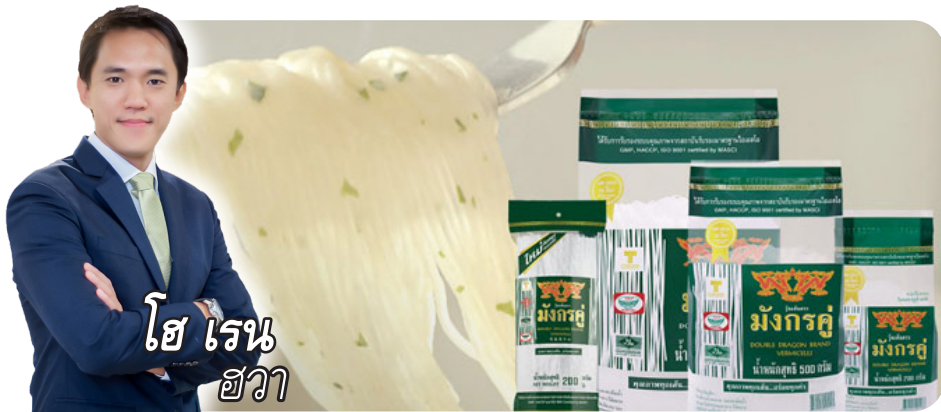
โฮ เรน ฮวา

นิวส์ คอนเน็คท์ – TWPC มั่นใจผลงานปีนี้โตต่อเนื่อง หลังได้บาทอ่อนหนุนส่งออกพร้อมเริ่มส่งแป้งมันสำปะหลังตามปกติหลังซบักขายช่วงต้นปี ทุ่มงบพันล้านเสริมทัพธุรกิจ